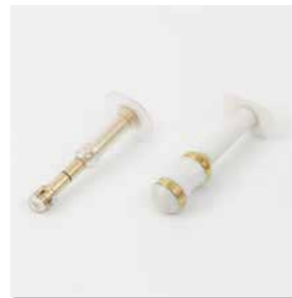
Le apposite sonde per elettrostimolazione vanno utilizzate in combinazione con i programmi specifici presenti sul dispositivo.

Spesso queste problematiche nascono da una riduzione del tono muscolare del pavimento pelvico (i muscoli che sostengono gli organi pelvici). Non dobbiamo pensare che questi disturbi siano tipici solo dell'invecchiamento, a volte possono essere situazioni temporanee dopo la gravidanza o in seguito a interventi chirurgici, altre volte compaiono solamente durante uno sforzo improvviso. In tutti questi casi l'utilizzo dell'elettrostimolatore GLOBUS in abbinata alle sonde vaginali o anali (accessori opzionali) possono risolvere la situazione. IL TUTTO NELL'INTIMITÀ DI CASA PROPRIA.